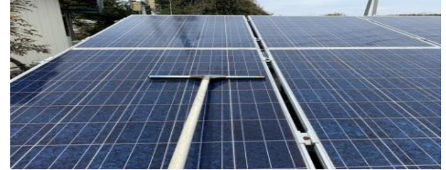
シャンパー・スクイジー